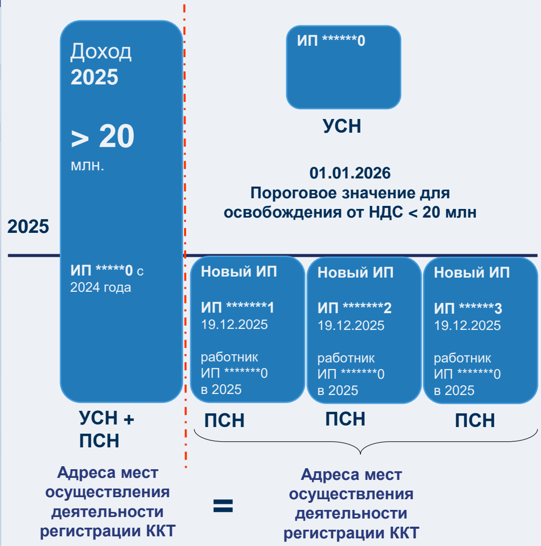
СХЕМА ДРОБЛЕНИЯ БИЗНЕСА – РЕГИСТРАЦИЯ БЫВШИХ РАБОТНИКОВ В КАЧЕСТВЕ НОВЫХ ИП